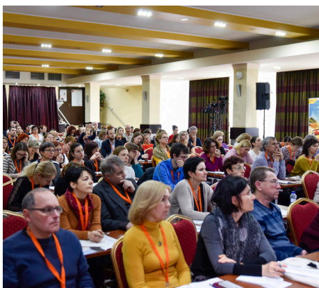
Letošní ročník Konference navštívilo 240 ambulantních i klinických neurologů.