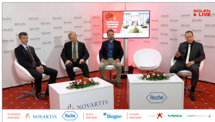
Čtvrteční ráno patřilo diskuznímu panelu na téma spondylodiscitidy , ve kterém odborníci z oborů neurologie, infekтологии, radiologie a neurochirurgie diskutovali o potřebě interdisciplinární péče v případě tohoto onemocnění.